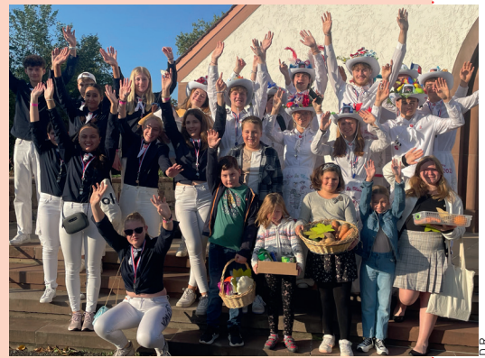
▲ Les conscrits et les enfants du Club Du Dimanche réunis pour le culte des récoltes à destination de l'épicerie sociale et solidaire l'Escal de Bischwiller.