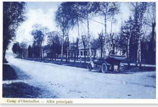
Camp d'Oberhoffen — Allée principale