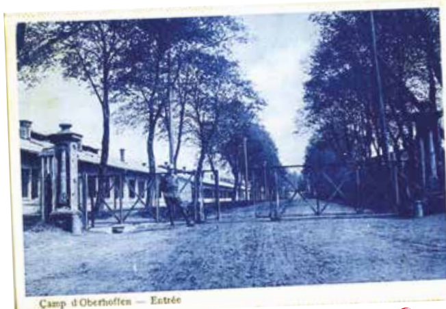
Camp d'Oberhoffen — Entrée